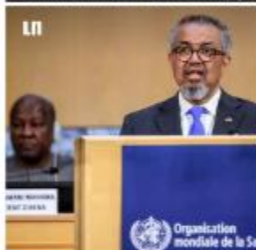
Director de la OMS subraya cooperación ante enfermedades: "Ningún país se solva solo"