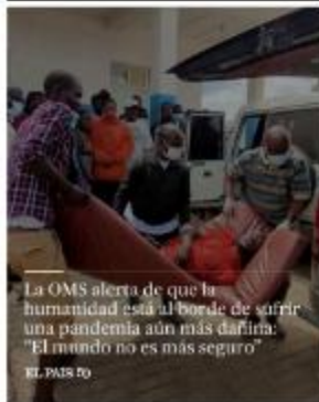
La OMS alerta de que la humanidad está al borde de sufrir una pandemia aún más dañina: "El mundo no es más seguro" EL PAÍS.RO

R/ No hay ninguna declaración de pandemia por parte del Ministerio de Salud, ni las hubo.