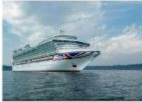
Impacto en otro crucero: qué es el norovirus, la enfermedad que terminó con la vida de un pasajero y generó la confinación de 1700 personas | canal26.com

San José, 01 de junio de 2026 CARTA-MS-DVS-229-2026 Página 5 de 6